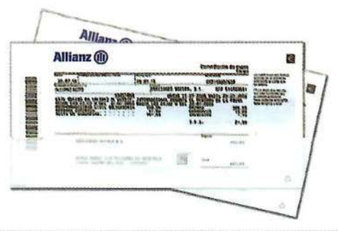
Recibo de haber pagado el seguro.

Cuando esto no sea posible, la vigencia del seguro quedará acreditada mediante el justificante de pago de la prima del periodo en curso. Por ello, aunque no es obligatorio, resulta muy recomendable llevar en el vehículo el justificante de pago del seguro.