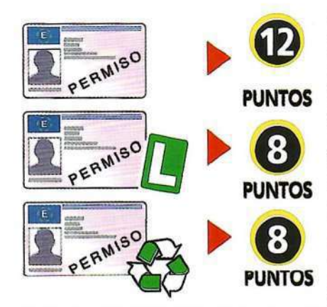
Permiso por puntos.

La superación de cursos de conducción segura y eficiente y siempre que se cumplan los requisitos establecidos y se tenga saldo positivo, se compensará con dos puntos adicionales hasta un máximo de 15 puntos y con una frecuencia máxima de un curso de cada tipo cada dos años.