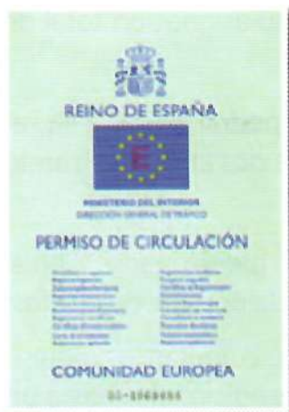
Permiso de circulación.