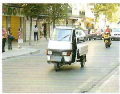
Ciclomotor de tres ruedas.