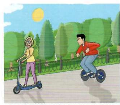
Vehículos de movilidad personal.

Vehículo de movilidad personal: vehículo de una o más ruedas dotado de una única plaza y propulsado exclusivamente por motores eléctricos que pueden proporcionar al vehículo una velocidad máxima por diseño comprendida entre 6 a 25 km/h. Solo pueden estar equipados con asiento o sillín si están dotados de sistema de autoequilibrado.