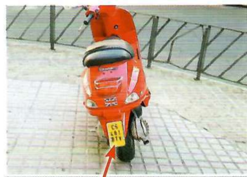
Placa de matrícula

La matriculación del ciclomotor se efectuará en la Jefatura Provincial de Tráfico del domicilio legal del propietario. El ciclomotor llevará una sola placa de matrícula en su parte posterior , con fondo de color amarillo y caracteres de color negro mate.