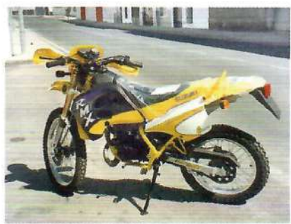
Ciclomotor de dos ruedas.

Ciclomotor: tienen la consideración de ciclomotor los vehículos que, a continuación, se definen: