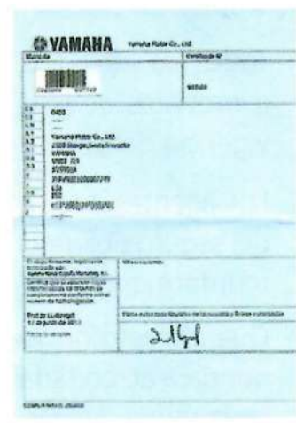
Tarjeta de inspección técnica (ITV).

Es un documento obligatorio para los ciclomotores , en el que se hacen constar las características de un ciclomotor correspondiente a un tipo homologado. Las características técnicas detalladas en la Tarjeta de Inspección Técnica o en el Certificado de Características no se podrán modificar. Cualquier reforma de importancia que se realice en el ciclomotor, deberá constar en dichos documentos.